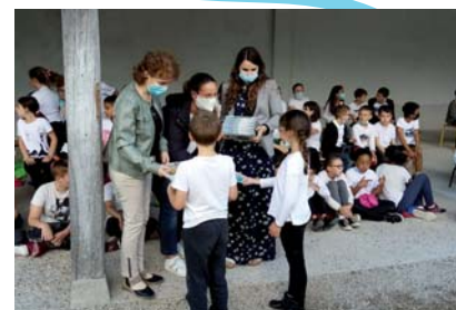
Remise des prix 2021, dont dictionnaire de français aux CM2 plus pochette surprise, en présence des élus de Bonnée.