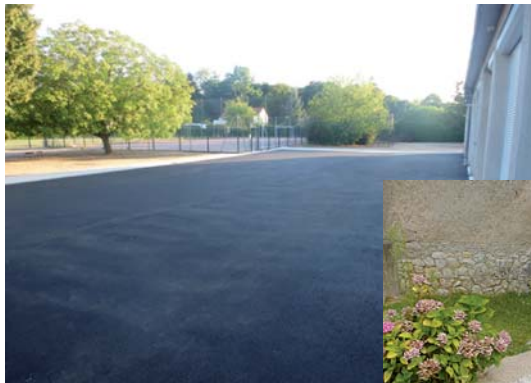
La cour de l'école