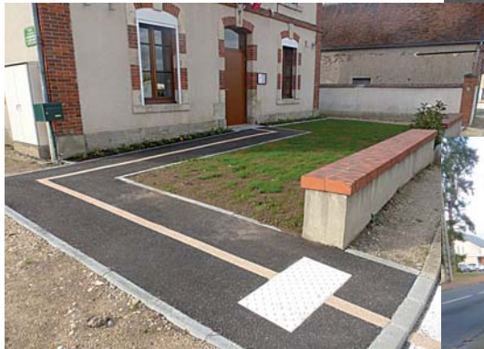
Accès aux personnes à mobilité réduite