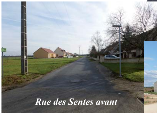
Rue des Sentes avant