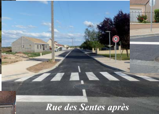
Rue des Sentes après