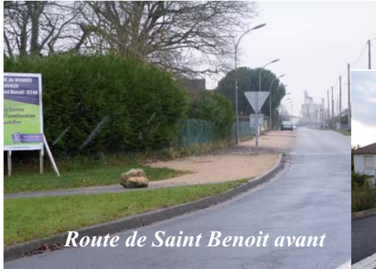
Route de Saint Benoit avant