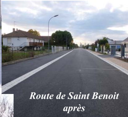
Route de Saint Benoit après