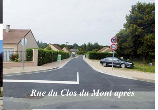
Rue du Clos du Mont après