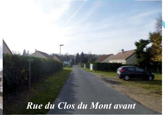
Rue du Clos du Mont avant